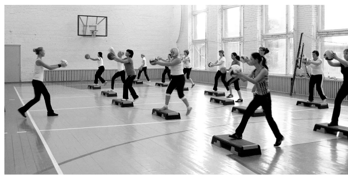
На занятиях по фитнесу.